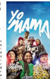
"Yo Mama" lance le festival ce soir à partir de 18h30 aux Ayalgalades.

La 2 e édition de Happy End fait découvrir gratuitement le cinéma à travers six projections plein air, des masterclass et des rencontres avec acteurs et réalisateurs jusqu'au 1 er septembre.